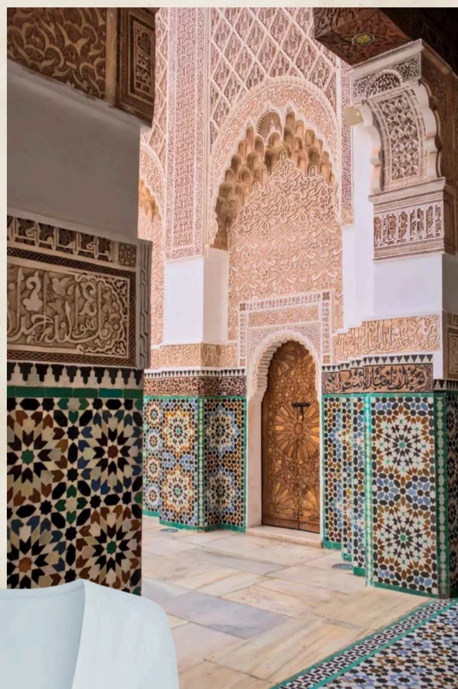
кардиган БЕЛАРТЕС /BELÁRTEС