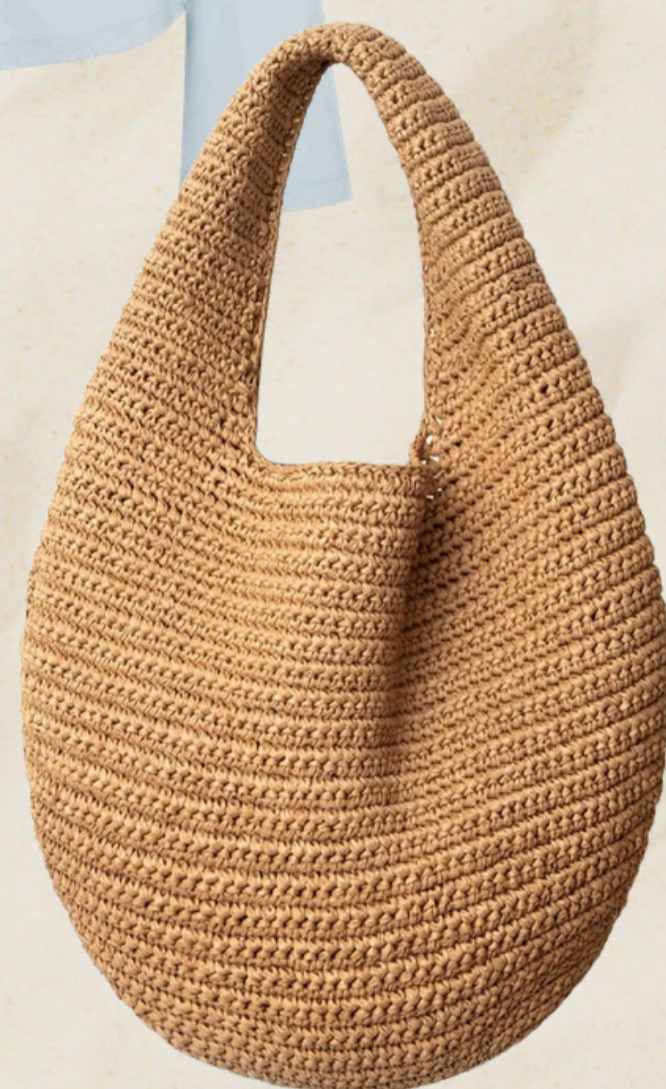
сумка SAINTART X SEEBÿME