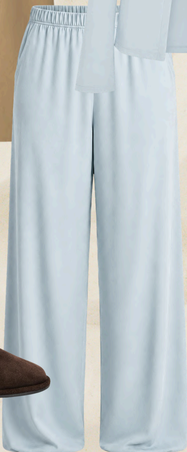
брюки БЕЛАРТЕС / BELÁRTEС