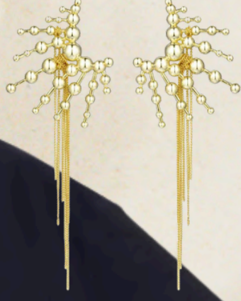
серьги CAVIAR JEWELLERY