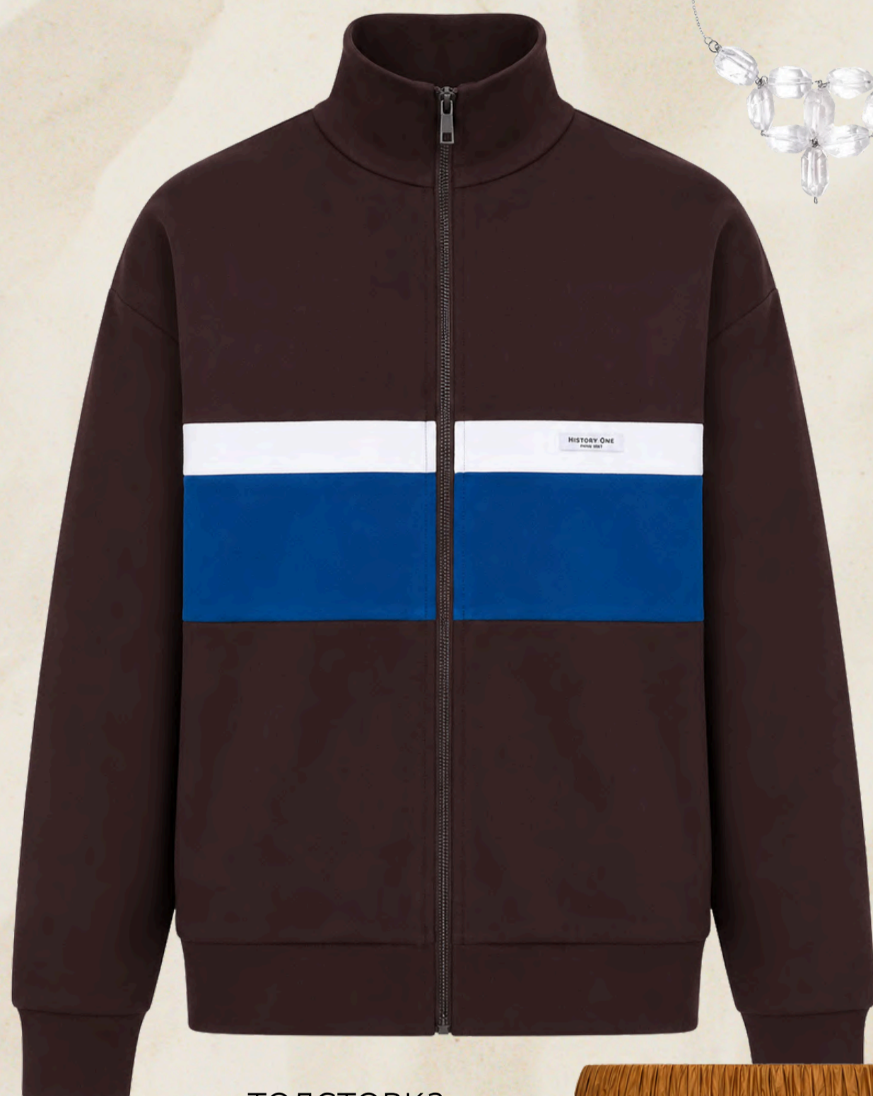
ТОЛСТОВКА HISTORY ONE