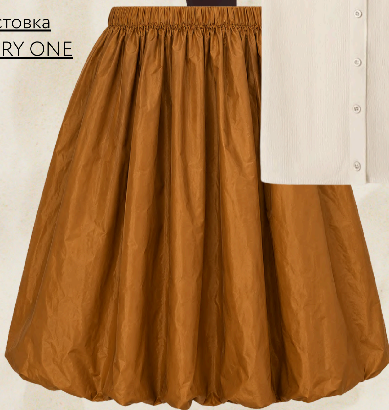
ЮБКА МЕМОРИИ И ВИСКЕРЫ