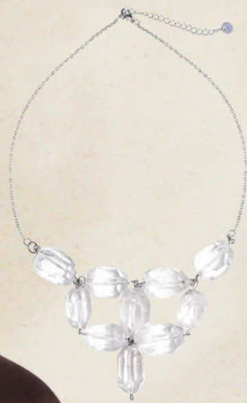
КОЛЬЕ ERÉ DE TOI